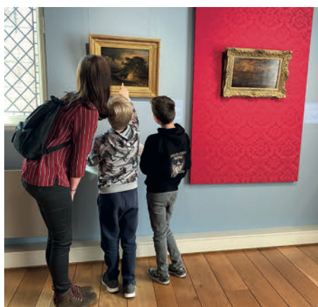
VTS rondleidingen en speurtocht DOEboek