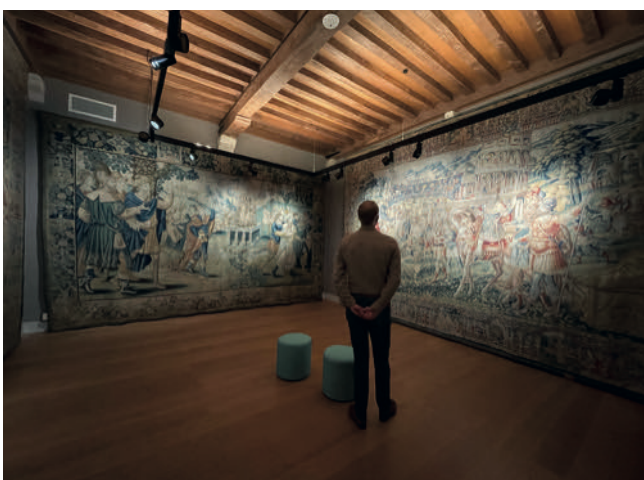
Iedereen zijn topstuk