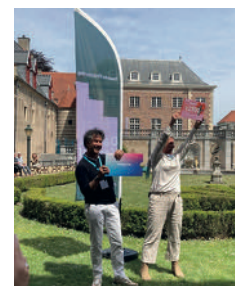
2 e prijs: Meest romantische kasteel van Nederland