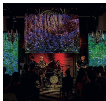
Earth & Fire