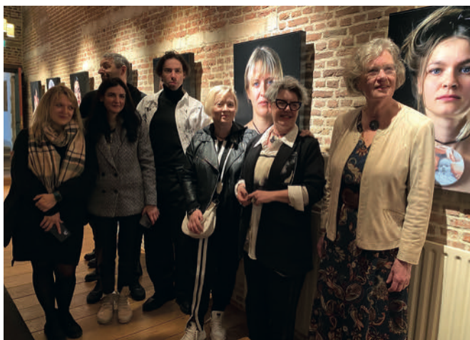
Opening foto-expo: The Hero In You

Op 24 februari 2022 werd de wereld ruw wakker geschud met het nieuws dat Rusland de aanval op Oekraïne had ingezet. Het impact-art-project met een fototentoonstelling en een documentaire van de Oekraïense vluchtelingen zijn te zien in het Markiezenhof.