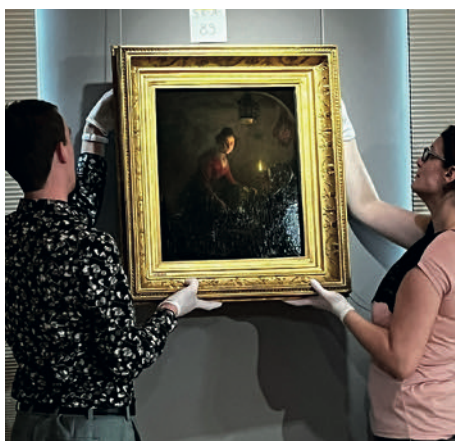
Bruikleen van het Rijksmuseum

Museum het Markiezenhof kent een actief conserveringsbeleid. Zo is de afdeling Collectiebeheer in 2017 gestart met het conserveren van de deelcollectie Zilver, waarbij alle zilveren objecten op verantwoorde wijze zijn gepoetst en geseald om de objecten in optimale staat te bewaren. Dit project is in 2023 afgerond. Daarnaast worden objecten en bruiklenen, die recentelijk zijn verworven, bij binnenkomst op verantwoorde wijze gepresenteerd en bewaard of geretourneerd. Naast dit actieve beleid op gebied van beheer en behoud, voert het museum sinds januari 2023 ook een actief restauratiebeleid. Dit houdt in dat ieder jaar een klein aantal objecten worden gerestaureerd die tot de kerncollectie of topstukken van het museum behoren.