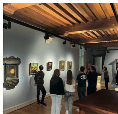
Kijk Binnen Bij Bedrijven