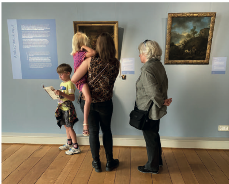
Expo Hete Vuren, Schatten uit het Rijks

Opnieuw een unieke samenwerking met het Rijksmuseum en Stichting M6. Het Markiezenhof heeft de primeur met Schatten uit het Rijks: Hete Vuren! De drie thema's Huiselijk vuur , Ambachtelijke vuur en Vernietigend vuur vormen de leidraad van deze vierde en afsluitende tentoonstelling in de vierdelige reeks na Lage Landen , Koele Wateren en Hoge Luchten .