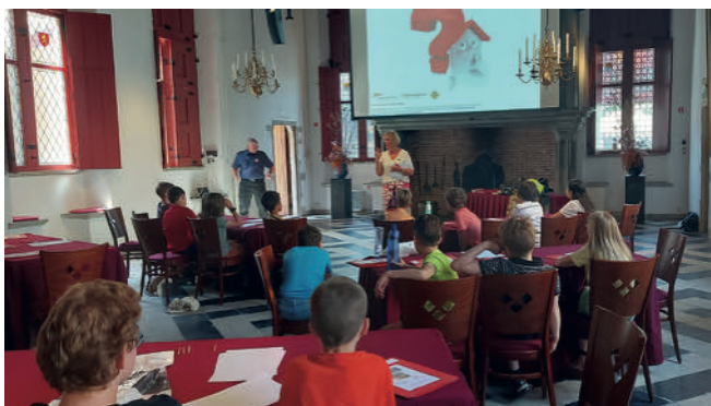
College: Brand! Wat doe je dan?

Het enthousiasme voor de collegereeks was weer groot. De collegereeks was zo goed als uitverkocht, 28 van de 30 plaatsen waren bezet en trotse ouders konden zien hoe hun kinderen na afloop van het laatste college hun diploma in ontvangst namen.