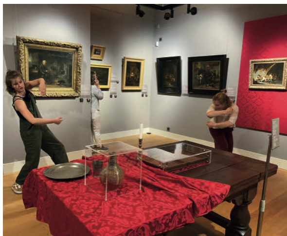
Openingsweekend Match met intieme dansperformance