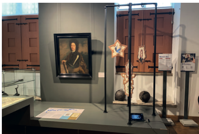
Menno's Reis, kunstwerk vanuit de Zuiderwaterlinie Alliantie

In 2023 trad het publiek in de voetsporen van vestingbouwer Menno van Coehoorn. De inspectiereis die hij 325 jaar geleden maakte langs de Zuiderwaterlinie, kon worden herbeleefd op vijf verschillende locaties, waaronder het Markiezenhof. Met name in Bergen op Zoom heeft hij zijn indrukwekkend sporen achtergelaten. Het Markiezenhof werkte voor dit project samen met de Alliantie Zuiderwaterlinie.