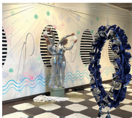
Dansperformance Soft Tissue