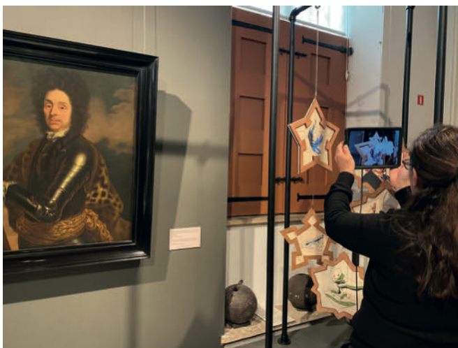
Kunstwerk vanuit de Zuiderwaterlinie in Zaal 1747

De ontwikkelingen rondom deze ruimte nemen een vlucht. Een positief advies tot toetreding tot het Geopark Schelde Delta maakt dat de voorbereidingen met betrekking tot een aanbestedingstraject zo goed als klaar zijn.