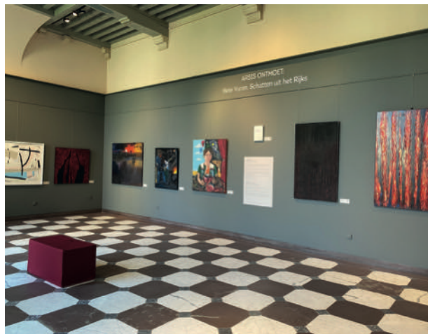
Arsis ontmoet: Hete Vuren, Schatten uit het Rijks

Zoals ook bij de vorige drie exposities van Schatten uit het Rijks heeft Arsis weer kunstenaars opgeroepen om in het kader van het thema Hete Vuren kunstwerken te maken en aan te leveren voor een parallele expositie.