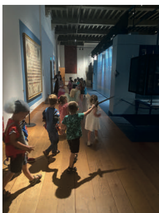
Ridders & Kastelen

Speciaal aanbod bij de expositie Hete Vuren, Schatten uit het Rijks. VTS activiteit vanaf groep 3; op een andere manier kijken naar kunst.