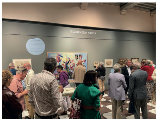
Opening expositie: 'Iedereen zijn topstuk'