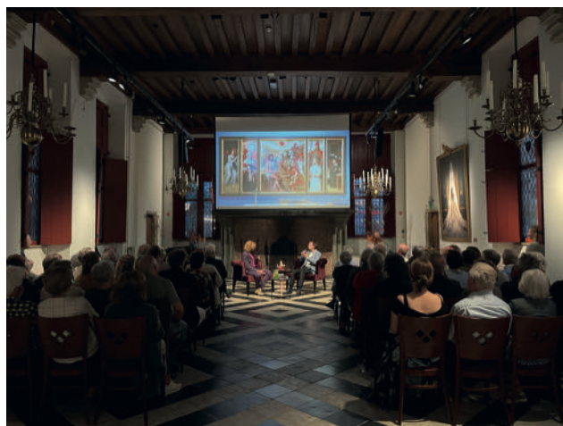
Opening expositie: 'Iedereen zijn topstuk'