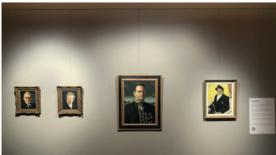
Mix & Match

Diverse 17 de t/m 21 ste -eeuwse portretten uit het depot zien het licht in deze tijdelijke tentoonstelling. De titel geeft een kleine knipooeg naar de tijdelijke tentoonstelling Match. Eén op één met het Rijksmuseum (2 juli – 3 september 2023) die aansluitend in dezelfde ruimte was te zien. Via een QR-code kon het publiek steeds twee favoriete portretten matchen en hier een verhaal bij vertellen.