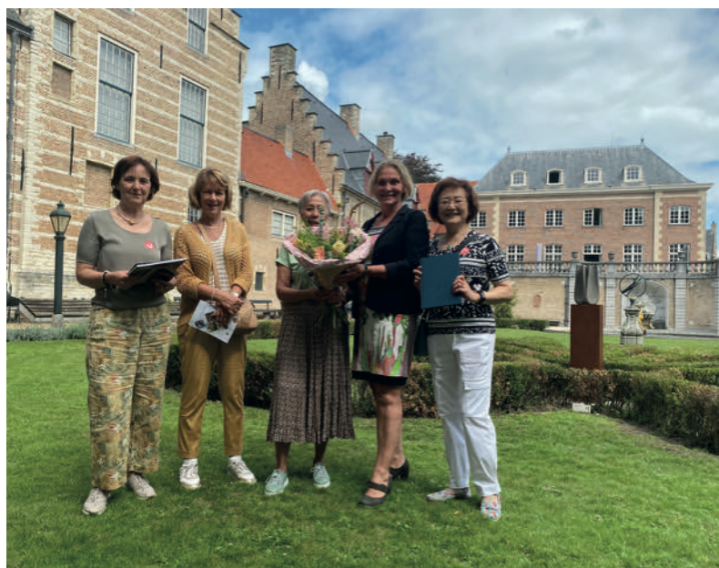
13000 ste bezoeker wordt in het zonnetje gezet