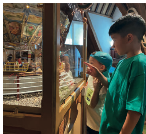
Komt dat zien, komt dat zien!