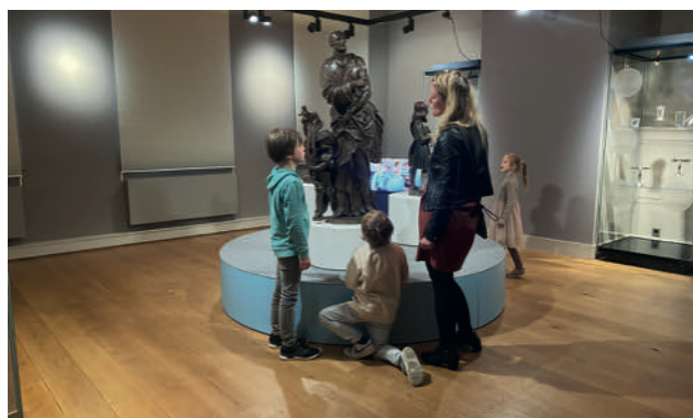
Iedereen zijn topstuk