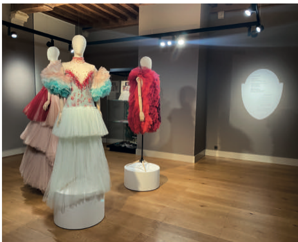
If Clothes Could Talk