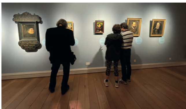
Iedereen zijn topstuk