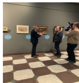
Vrijwilligers aan het woord voor Iedereen zijn topstuk