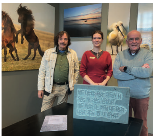
Kalligrafiesteent en gedicht