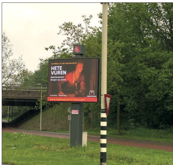
Billboard reclame Hete Vuren