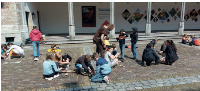
College: Vuur door de eeuwen heen...

Een archeotolk van het Archeon nam de kinderen mee terug naar de prehistorie en vertelde over het belang en de rol van vuur in die tijd. Daarna mochten de kinderen ook zelf rook en vuur gaan maken.