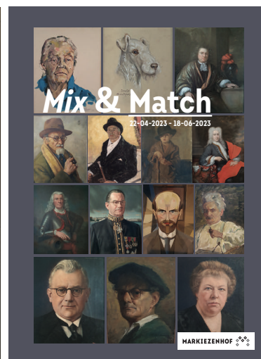
Handout, boekje Mix & Match