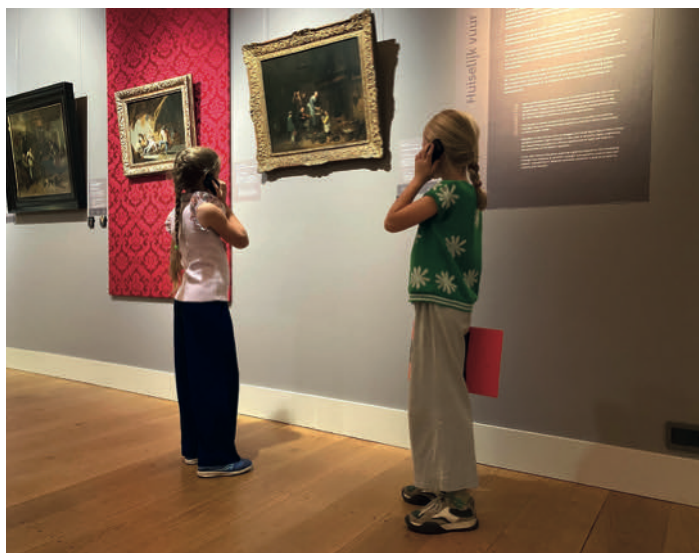
Audioguide voor kinderen bij de expositie Hete Vuren