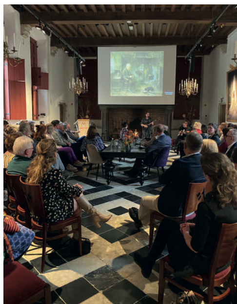
Opening met singer-songwriter Elly Kellner