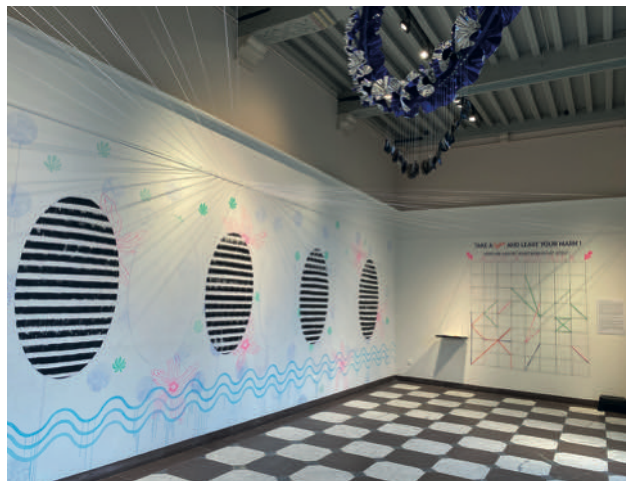
A Second Skin